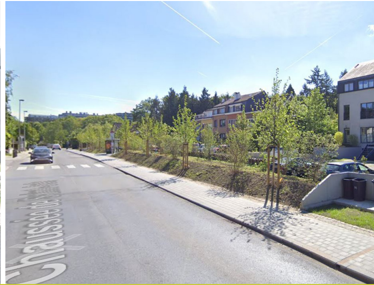
> Voor / na

water valoriseren en warmte- en droogte-eilanden tegengaan. Het afvloeiende regenwater en het regenwater van op de daken worden naar de gracht afgevoerd. Daar wordt het water met behulp van kleine muurtjes (stuwen) vastgehouden zodat het de tijd krijgt in de grond te sijpelen. Onderaan de muurtjes bevinden zich sproeiers. Deze zorgen voor de afvloeiing van het water met een beperkt debiet naar de volgende stuw, enzovoort. Een rooster voorkomt verstopping en vergemakkelijkt het onderhoud.