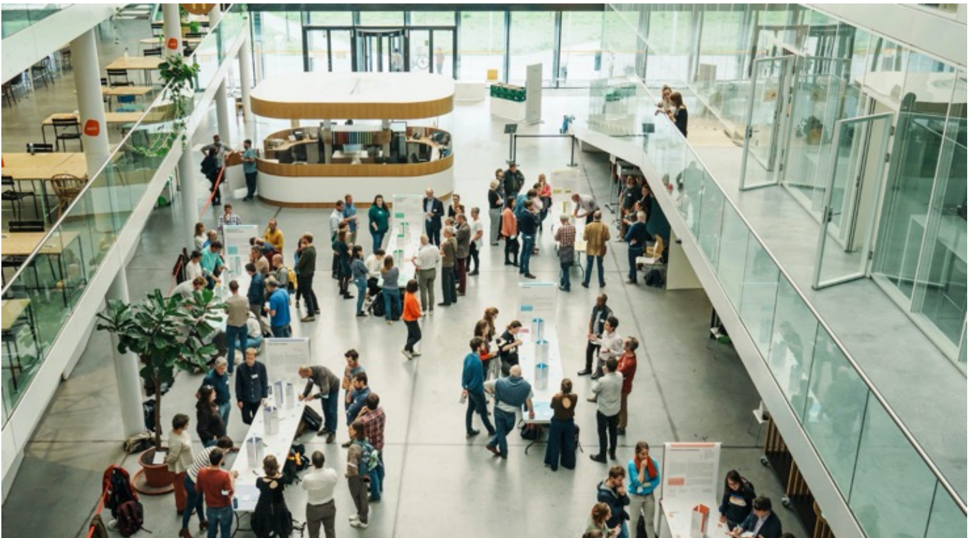
> Dag van de Alliantie RENOLUTION bij Leefmilieu Brussel - 29/11/2021