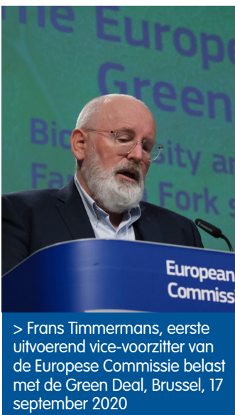
> Frans Timmermans, eerste uitvoerend vice-voorzitter van de Europese Commissie belast met de Green Deal, Brussel, 17 september 2020

Tijdens de COP25, de internationale klimaatconferentie van eind 2019 in Madrid, lanceerde de Europese Commissie haar "European Green Deal". Dit ambitieus plan moet van Europa het eerste klimaatneutrale continent maken tegen 2050. De Green Deal moet de EU op weg helpen bij de omvorming naar een eerlijke én welvarende maatschappij met een moderne, grondstoffenefficiënte en competitieve economie, waarbij tegen 2050 de netto-uitstoot van broeikasgassen nul wordt en de economische groei ontkoppeld wordt van het grondstofgebruik. De Green Deal is een geïntegreerde en transversale strategie die bijna alle beleidsdomeinen bestrijkt.