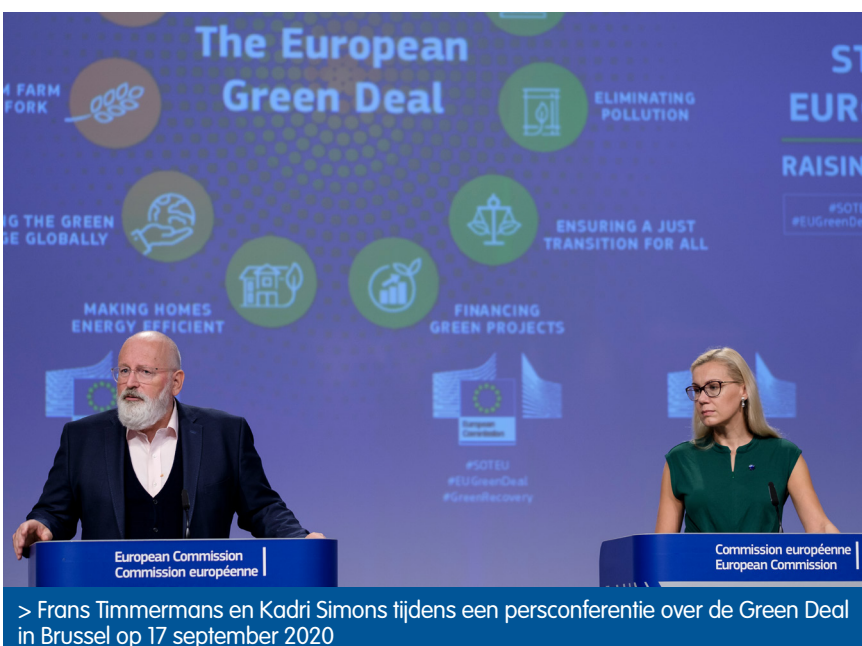
> Frans Timmermans en Kadri Simons tijdens een persconferentie over de Green Deal in Brussel op 17 september 2020

Ook de sociale ongelijkheid wordt op financieel vlak aangepakt. Het Just Transition Mechanism is een essentieel onderdeel van het investeringsplan. Het Mechanism omvat ook het Just Transition Fund. Het zal de regio's in alle lidstaten die sterk afhankelijk zijn van fossiele brandstoffen en van koolstofintensieve activiteiten, helpen bij de overgang naar een koolstofarme economie.