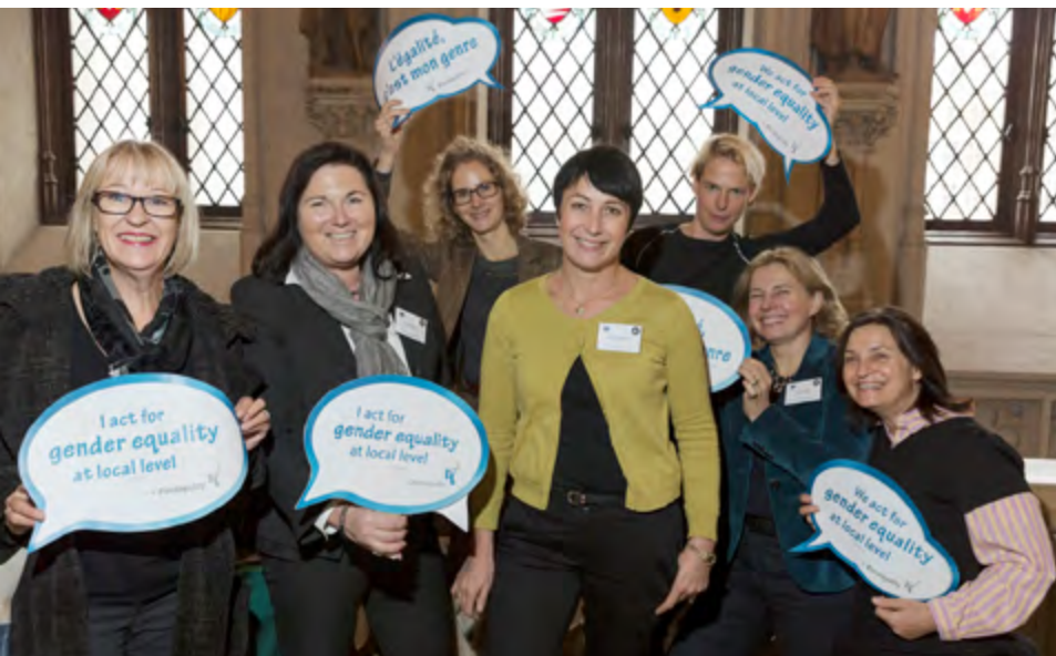
> Lancering in Brussel (op 14 oktober 2015, stadhuis) van de toolbox ter ondersteuning van de collectiviteiten bij het plannen, opvolgen en evalueren van een gelijke kansenbeleid.

Tot onze ondertekenaars behoren verschillende nationale verenigingen van steden en gemeenten of regionale verenigingen. Hoe talrijker we zijn, hoe meer gelijkheid we zullen krijgen!”