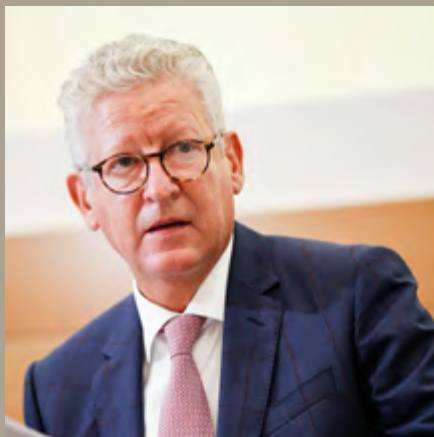
> Pieter de Crem, minister van Binnenlandse Zaken bij de start van de crisis.

Op dat moment nam de federale overheid de controle over het beheer van de coronacrisis over. Er kwam voor het hele Belgische grondgebied een gecentraliseerde en uniforme besluitvorming. Krachtens deze strategische coördinatiebevoegdheid heeft de federale overheid (in de persoon van de minister van Binnenlandse Zaken) onder het prisma van eenheid van commando de lokale overheden en de minister-president van het Brussels Hoofdstedelijk Gewest (als gedecentraliseerde overheden) instructies gegeven om de gezondheids crisis te beheersen 28 .