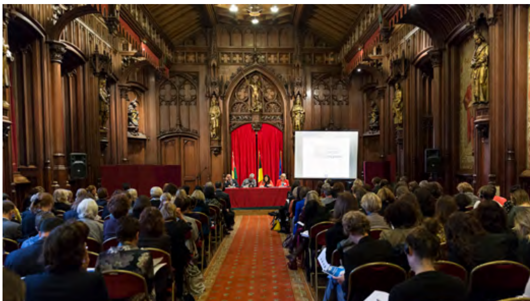
> Lancering in Brussel (op 14 oktober 2015, stadhuis) van de toolbox ter ondersteuning van de collectiviteiten bij het plannen, opvolgen en evalueren van een gelijke kansenbeleid.

Hier is voor ons een belangrijke taak weggelegd om via de lidverenigingen - en dit interview is een eerste stap - en het netwerk van nationale coördinatoren de contacten met de lokale en regionale gemeenschappen te vernieuwen en hen te doen realiseren dat ze dat engagement zijn aangegaan. Of zelfs om dat engagement opnieuw aan te wakkeren.