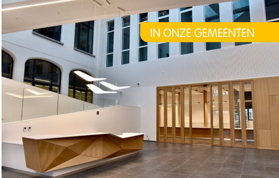
> Het nieuwe atrium

"De interne competenties van een gemeente maken het beheer van dergelijke grootscheepse projecten ingewikkelder, omdat dit uiteraard niet onze primaire taak is. We moeten daarom externe bureaus betalen die ons daarbij begeleiden, maar die bureaus nemen ook niet bepaald veel verantwoordelijkheid. Wanneer er dus iets niet goed loopt, kunnen we maar zelden de aannemers aanklagen, omdat de opvolging uitbesteed werd. De overheid staat dan volstrekt machteloos tegenover de problemen die ze zich nadien voordoen. Gelukkig behandelen het schepencollege, de dienst architectuur en de dienst juridische aangelegenheden deze kwesties samen met ons."