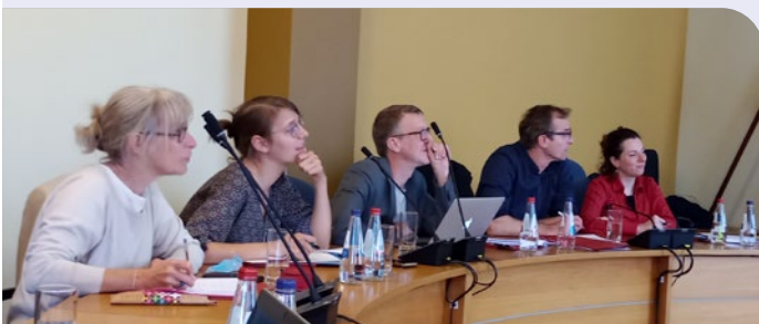
> Les partenaires réunis à Jelgava (Lettonie)

Pendant que La Ville de Bruxelles en collaboration avec le BAPA Bruxelles et son groupe local de soutien aidait nos partenaires français, nos collègues de la Commune de Schaerbeek accompagnés des représentants de BAPA VIA et des représentants du milieu associatif local se sont rendus à Jelgava, en Lettonie, afin d'aider nos