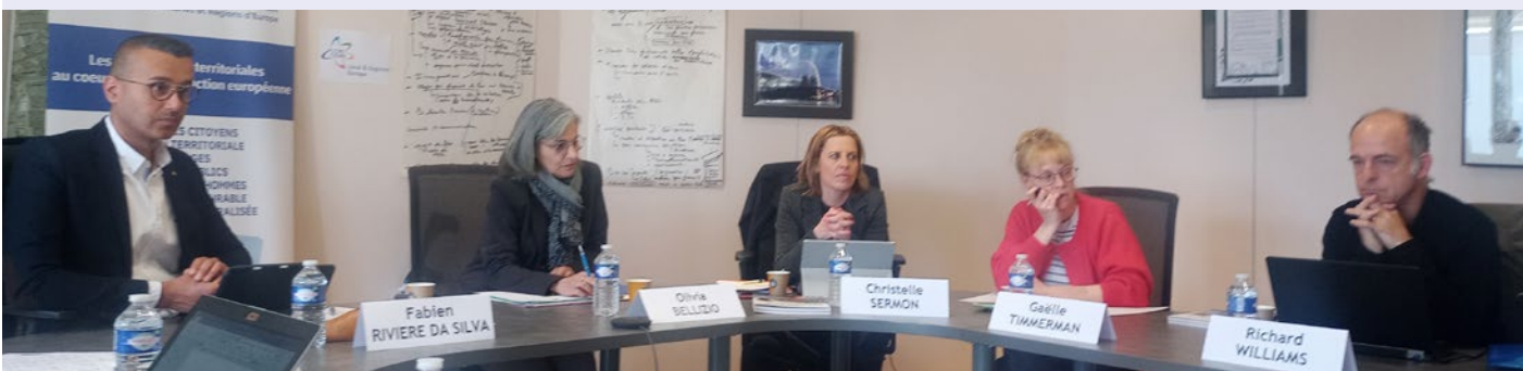
> Rencontre à Saint-Jean-de-la-Ruelle (France)

Contact : Justyna Podrazka justyna.podrazka@brulocalis.brussels