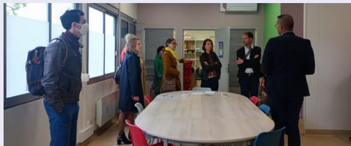
> Future Maison des Femmes

Le projet IncluCities de la Commission Européenne ( www.inclucities.eu ), au cours duquel Brulocalis accompagnait les dernières années la Ville de Bruxelles et la Commune de Schaerbeek, prendra bientôt fin.