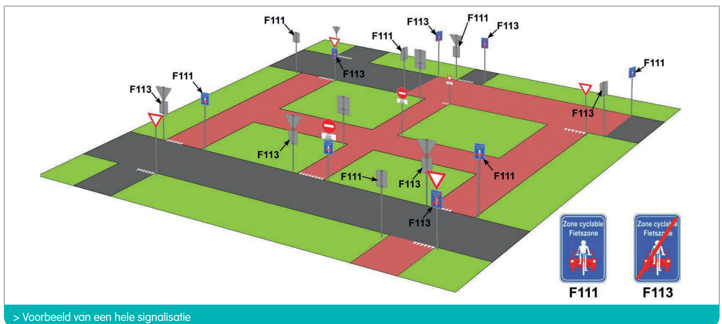
> Voorbeeld van een hele signalisatie