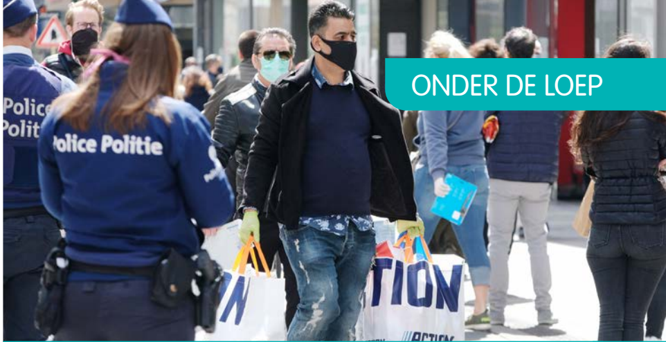
> Tijdens corona heeft de minister van Binnenlandse Zaken overal in het land de horeca kunnen sluiten.

als de handeling zich beroept op urgentie om zeer zware maatregelen voor te schrijven (zoals de evacuatie of zelfs de sloop van een gebouw) of om de betrokkene niet te moeten horen, zal de handeling duidelijk de dringende noodzaak moeten aantonen.