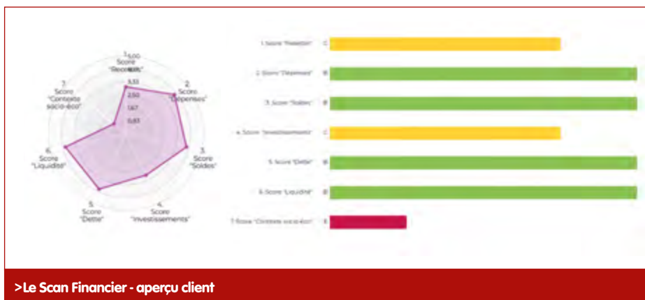
> Le Scan Financier - aperçu client

Chaque axe est lui-même composé de différents ratios qui reçoivent chacun un score. Les valeurs seuils pour passer d'un score à un autre sont déterminées par rapport à la distribution statistique pour l'ensemble des communes du pays.