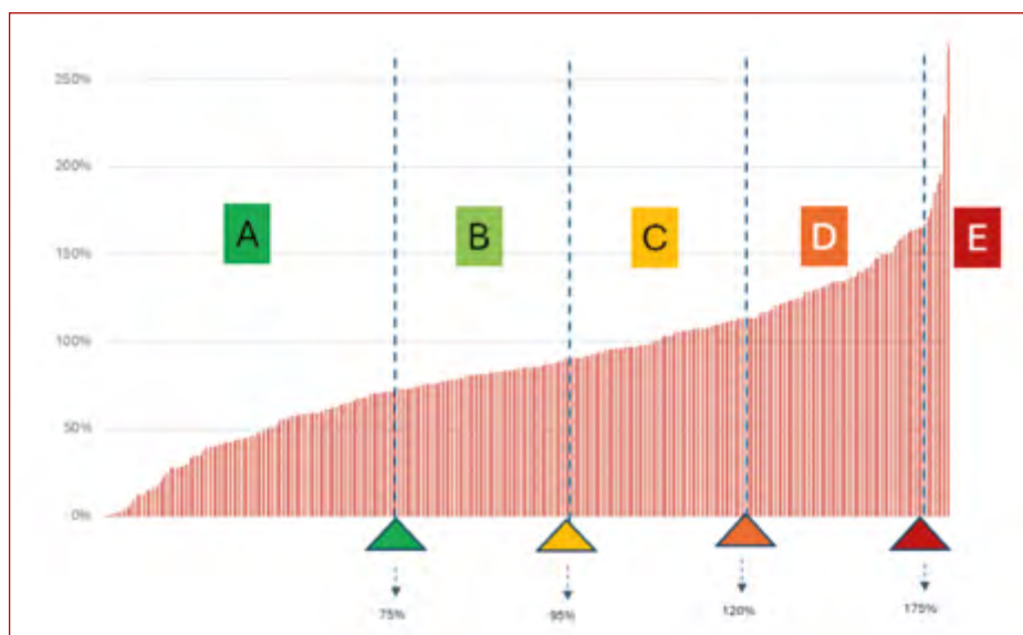
> Ratio d'endettement – répartition des résultats pour les communes wallonnes et bruxelloises