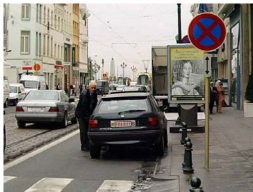
En dépit de la signalisation... et des panneaux de sensibilisation, les mauvaises habitudes persistent.

Les mesures des temps de passage des trams dans le "goulet", effec-