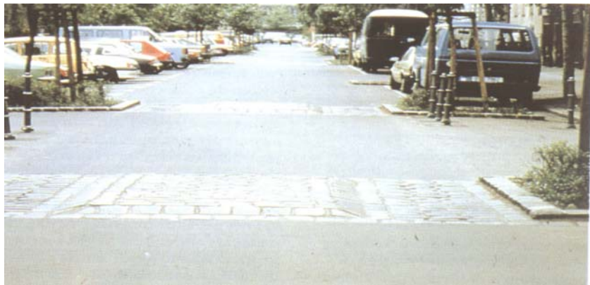
Ce type d'aménagement est maintenant aussi autorisé en Belgique, sous certaines conditions, et complété d'un marquage spécifique

Ce même Moniteur publie aussi la circulaire ministérielle relative aux coussins berlinois.