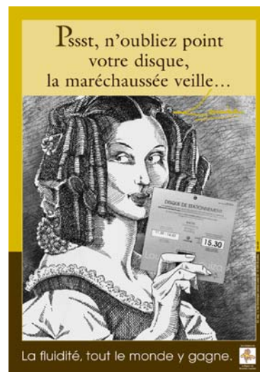
Une campagne de communication non dénuée d'humour... et de charme

Contact : M. Caelen (AVCB), mobility@avcb-vsgb.irisnet.be