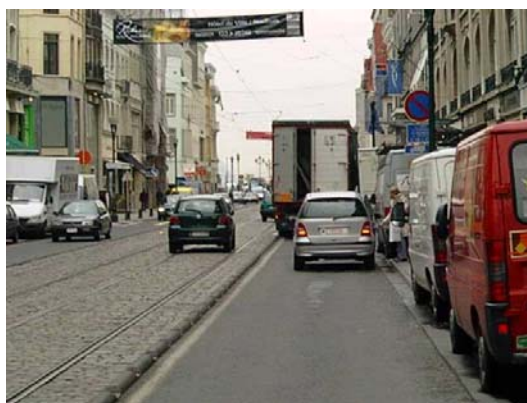
Le déchargement sur la voirie et les doubles files rejettent la circulation sur le site tram.

La situation du "goulet" est très complexe, tant au niveau géographique qu'institutionnel, puisqu'elle implique de nombreux intervenants. Jugez plutôt. Il s'agit d'une artère régionale, dont la chaussée se situe sur le territoire de Bruxelles-Ville, tandis que les trottoirs dépendent des communes d'Ixelles et de Saint-Gilles. En outre, le "goulet" s'étend sur deux zones de police et plusieurs lignes de tram de la STIB empruntent le fleuron bruxellois...sur un site franchissable. Ajoutons à cela que l'itinéraire cyclable A (petite rocade) croise l'avenue Louise à hauteur de la