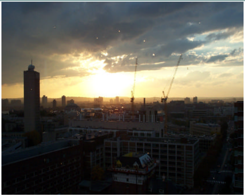
Cambridge au couché du soleil