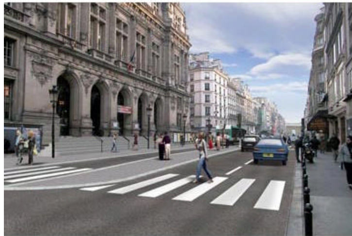
Rue du Faubourg Saint-Martin après les travaux

A la lecture de ces quelques exemples de bonnes pratiques, on se rend compte de l'enjeu capitale que représente un réseau de transport public